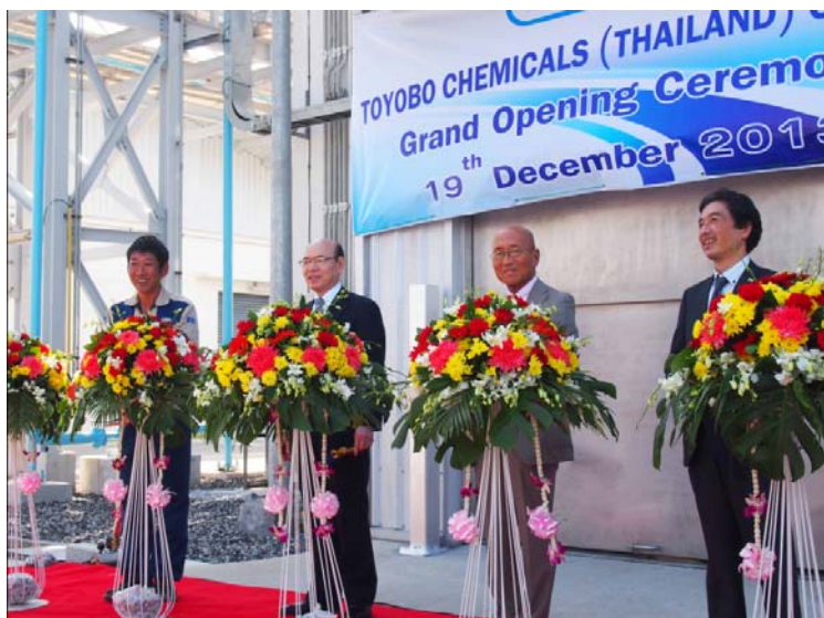
オープニングセレモニーの様

それに先立ち、12月19日に東洋紡ケミカルズタイランド株式会社のオープニングセレモニーを現地で行いました。