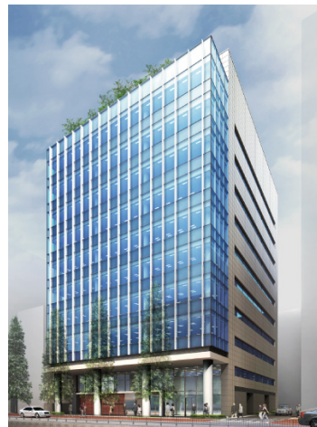
【移転先の住友商事京橋ビル】

業務開始日 2014年1月6日(月) 新住所 〒104-8345 東京都中央区京橋一丁目17番10号 住友商事京橋ビル 新電話番号 03-6887-8800(代表) 新FAX番号 03-6887-8829