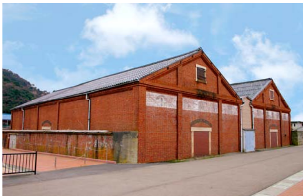
敦賀赤レンガ倉庫

建設から 110 周年となる今年、北棟は当時の敦賀市を再現した「ジオラマ館」として生まれ変わりました。館内には、国際港湾都市として栄えた敦賀の町並みや、その繁栄を支えた鉄道や港を再現した「巨大ノスタルジオラマ」が展示されます。また、当時を写した映像の中では、昭和初期の当社敦賀工場も紹介されます。