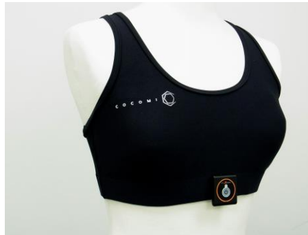
三浦 愛選手に提供する「スマートセンシングウェア®」

今回のスポンサー契約によって、モーターレースという過酷な環境下における「COCOMI®」や「スマートセンシングウェア®」の性能をテストし、今後のさらなる高性能化につなげていきます。