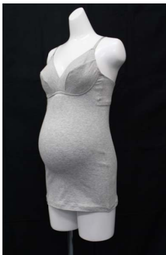
「myBeat」 「COCOMI®」 を使用したスマートテキスタイル