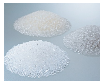
「TOYOBO GS Catalyst®」を使用して製造した PET 樹脂（左前）

製造受託している生分解性樹脂「APEXA®」の製造にも使用されています。2017 年には、PET 樹脂製造最大手のインドラマベンチャーズと「TOYOBO GS Catalyst®」を使用した重合技術や特許に関するライセンス契約を締結しました。