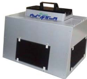
硫化水素用空気清浄機 (H2S10F09)

従来法に比べて初期コストの大幅低減が可能、また年間の電気代も 25,000 円程度です。