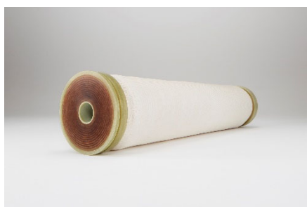
中空糸型正浸透(FO)膜

このたび SaltPower 社が実用化に成功した浸透圧発電プラントでは、製塩工場で使用するため地下の岩塩層 ※2 からくみ上げられた飽和濃度に近い高濃度の塩水と淡水との塩分濃度の差を利用し、100kw 規模の発電を実現します。水分子を通し塩分など一定の大きさ以上の分子やイオンを通さない性質を持つ当社の FO 膜を隔てて高濃度の塩水と淡水を接触させると、浸透圧差により塩水側に水が移動し、流量が増加します。この流量の増加を利用してタービンを回すことで発電する仕組みです。