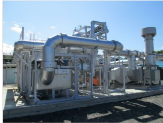
VOCを回収し地球環境保全に貢献する 環境ソリューション装置