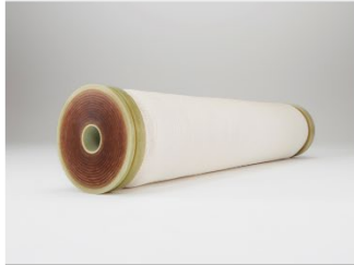
世界の水問題の解決に貢献する アクア膜