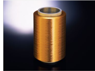
浮体式洋上風力発電の普及に貢献する 超高強度繊維