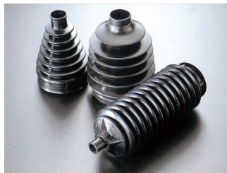
自動車の軽量化に貢献する エンジニアリングプラスチック