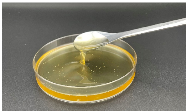
微生物が生産する界面活性剤「マンノシルエリスリトールリピッド」

当社は、このほど、国立研究開発法人新エネルギー・産業技術総合開発機構（以下「NEDO」）が公募する「バイオものづくり革命推進事業」の実施予定先 *1 として採択されました。これを受けて当社は、NEDO の支援のもと、微生物を使って生産する天然由来の界面活性剤「マンノシルエリスリトールリピッド」の利用分野拡大に向けた革命的生産システムの開発について、取り組みを開始いたしましたのでお知らせいたします。